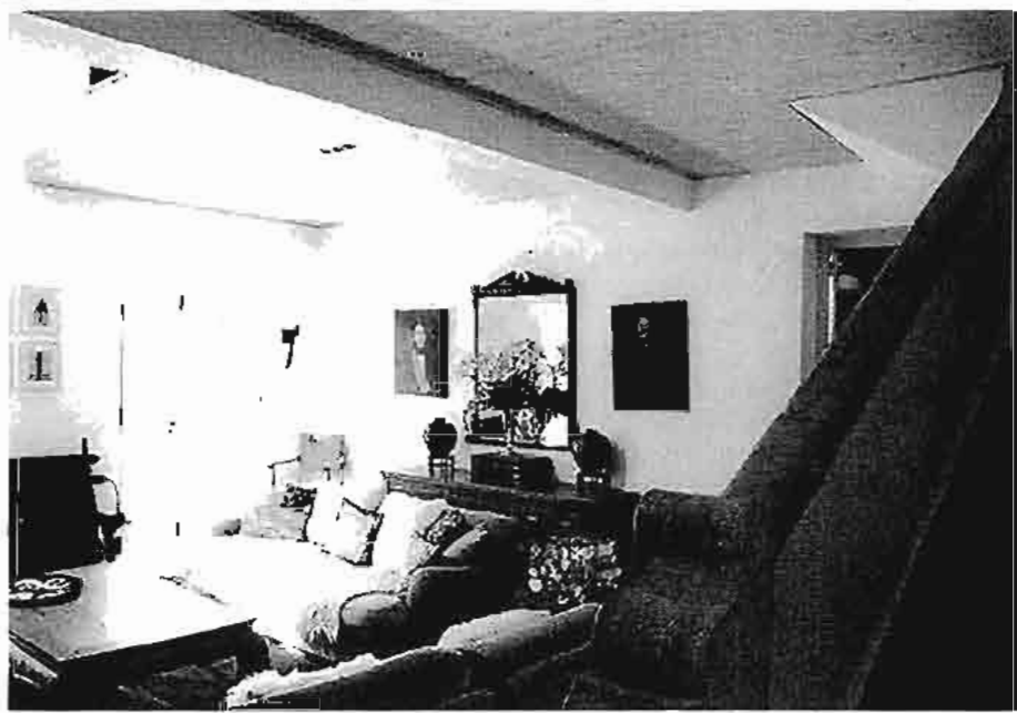
Sem nunca ultrapassar a área de construção original, a velha ruína evoluiu para uma moradia ampla e acolhedora