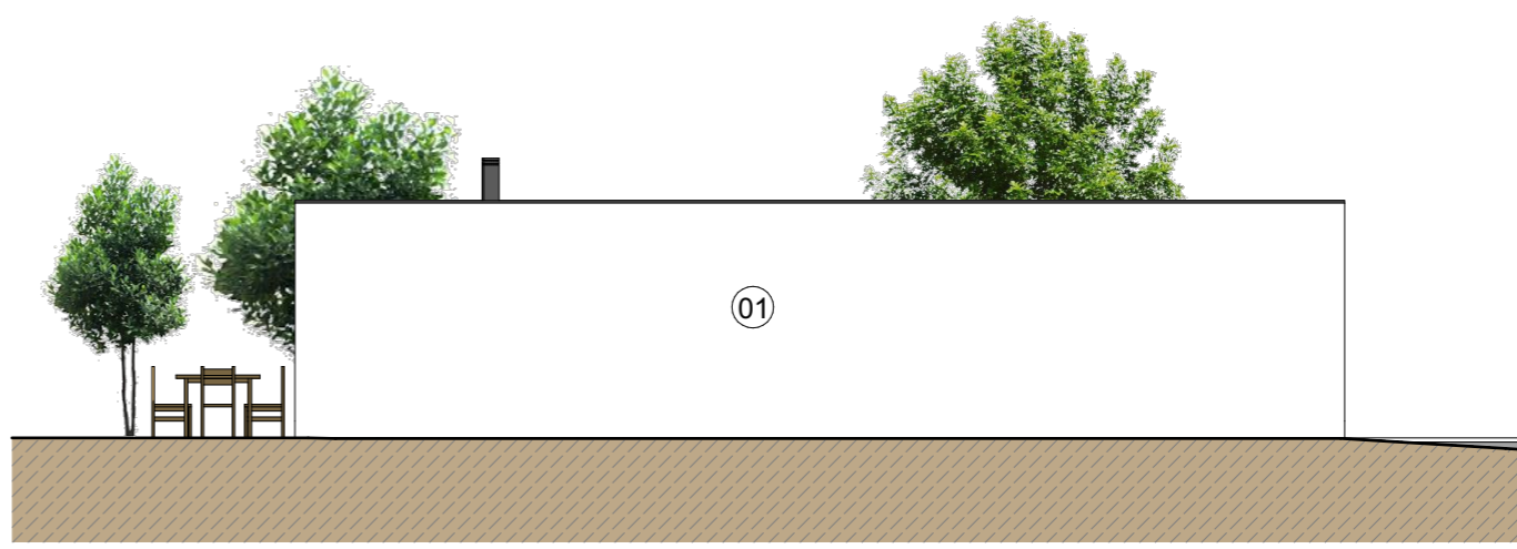
A3 Alçado lateral esquerdo Esc: 1:100