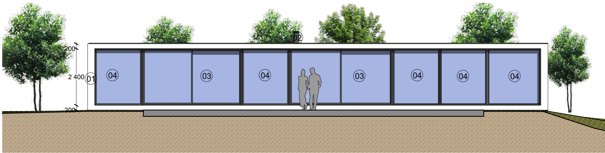
A1 Alçado principal Esc: 1:100