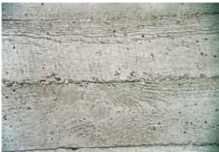
Tratamiento en veladura (sin masilla), las coqueras se mantienen abiertas