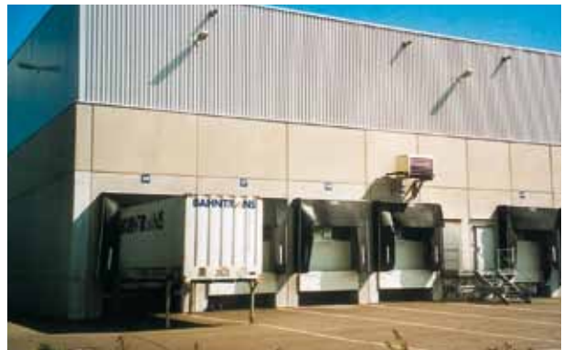
Posibilidad de suavizar notablemente las manchas, o igualación completa con aspecto mineral