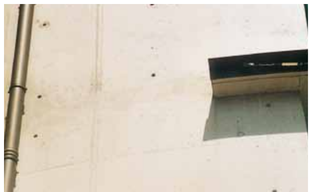
Reducción del impacto visual de los enmasillados, o igualación completa con aspecto mineral