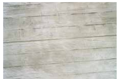
Reproducción de la textura del entablillado en las zonas reparada