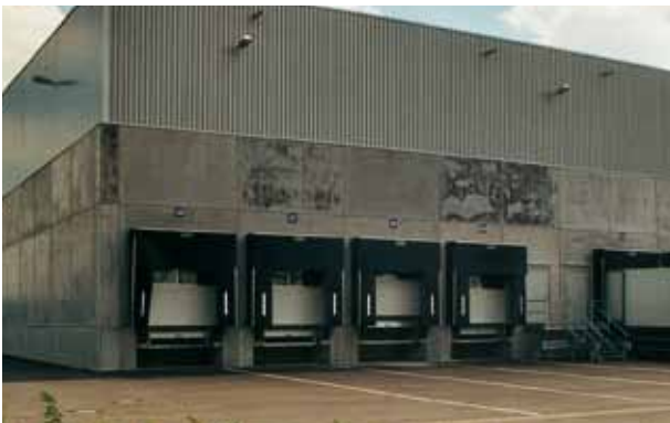
Hormigón nuevo con manchas importantes