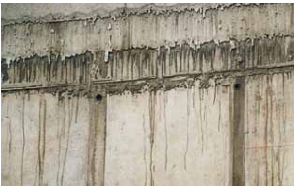
Hormigón nuevo mal ejecutado con necesidad de enmasillado