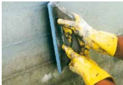
Tendido rascado, aplicado con llana de esponja o de goma dura. Se mantiene la textura del encofrado entablillado.