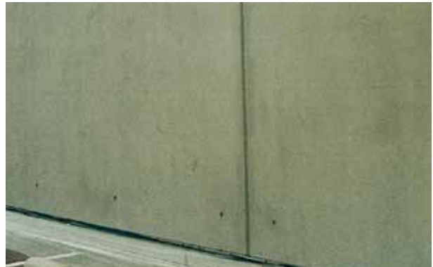
Aspecto mineral homogéneo con KEIM Concretal-Lasur