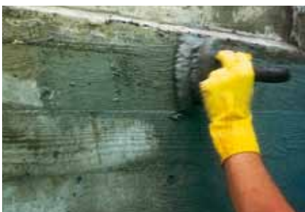
Lechada para cubrir coqueras, aplicada a cepillo. Se mantiene la textura basta de las tablas de encofrado.