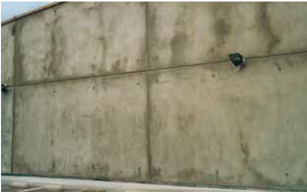
Hormigón nuevo con ligeras manchas