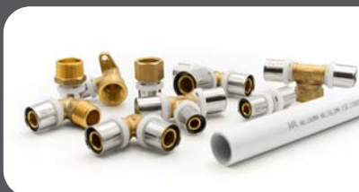
ACESSÓRIOS KLIMAPRESS Ø 16-75