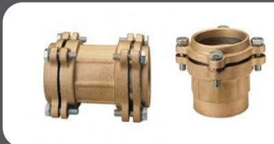
ACESSÓRIOS FLANGEADOS Ø 75-110