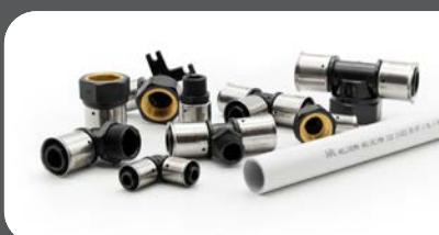
ACESSÓRIOS KLIMAPRESS PPSU Ø 16-32

O tubo Multicamada PE-RT / AL / PE-RT Isolado é compatível com os seguintes acessórios: