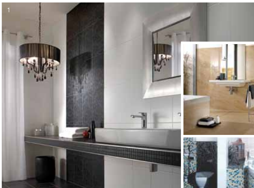
1 Bancadas e prateleiras